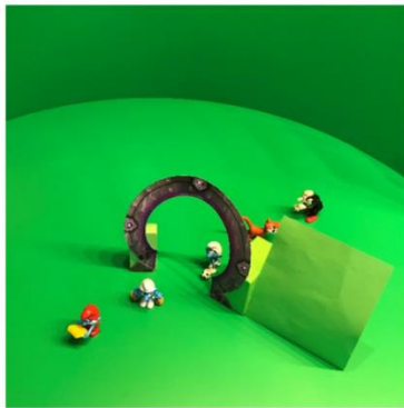
De smurven in de Greenscreenbox

Ben je enthousiast geworden maar weet je nog niet hoe je dit moet aanpakken? Wees gerust! We geven je alles wat je nodig hebt. Zo kun je snel aan de slag.