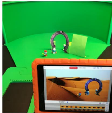
De app verandert het groen naar de ingestelde achtergrond